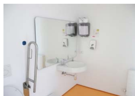
Cambra higiènica adaptada