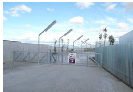
Accés al centre

La porta d'accés al pati general és d'una fulla que permet un pas lliure de 0,90 m d'ample i els tiradors són de tipus palanca. La fulla és de vidre i està emmarcades per un marc de color contrastat de 10 cm d'ample. No existeix cap ressalt entre l'interior i l'exterior.