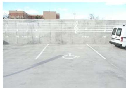
Plaça d'aparcament reservada