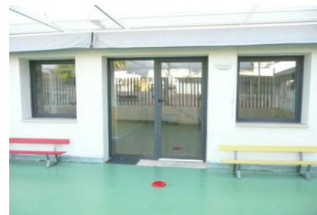
Accés al pati