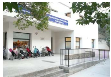
Rampa i escala accés edifici