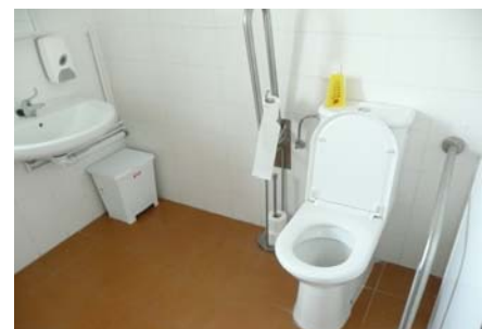
Cambra higiènica adaptada