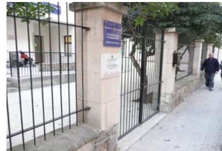
Accés al centre

La porta d'accés al pati és de dues fulles que permeten un pas lliure de 0,95 m d'ample cada una i els tiradors són de tipus palanca. La fulla de vidre es troba emmarcada per un marc de color contrastat de 10 cm d'ample. Al llindar de la porta no existeix cap ressalt. Existeix una moqueta fixada al paviment circumdant.