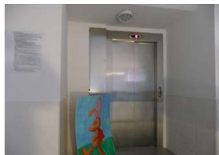
Ascensor - planta baixa

Recomanem estudiar la possibilitat d'ampliar el replà d'embarcament de l'ascensor en planta primera per tal que sigui possible inscriure un cercle de diàmetre 1,50 m. Proposem la col·locació al costat de la porta de l'ascensor en cada planta, d'un número en alt relleu que identifiqui la planta, amb unes dimensions mínimes de 10 x 10 cm i a una alçada de 1,40 m.