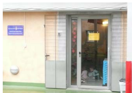
Entrada a l'edifici