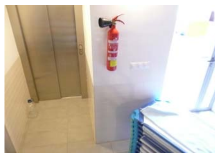
Ascensor - planta primera