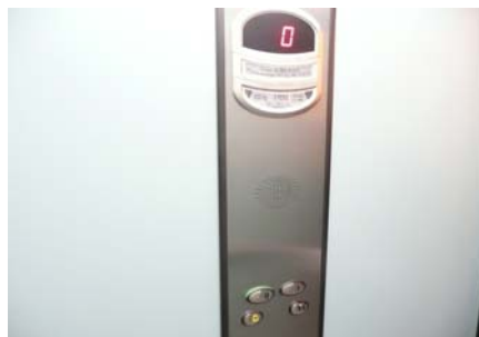
Ascensor - detall botoneres