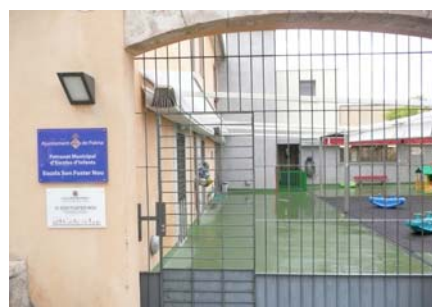
Accés al centre