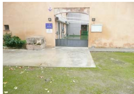
Accés al centre

La planta està organitzada en forma de L. El passadís d'accés a les aules i als despatxos té una amplada de 1,20 m, no presenta desnivells ni graons aïllats, i permet inscriure un cercle de diàmetre 1,20 m davant de totes les portes.