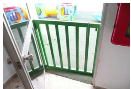
Accés pati lateral