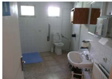
Cambra higiènica situada al menjador