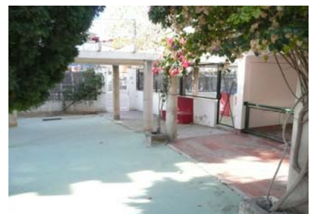
Itinerari d'accés a l'edifici