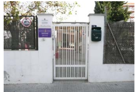
Accés al centre