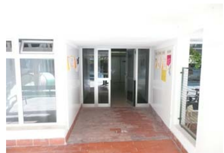
Accés a l'edifici