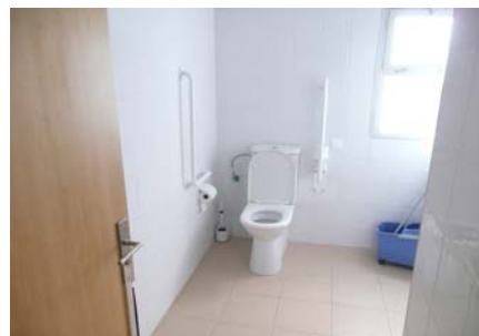
Cambra higiènica situada al passadís