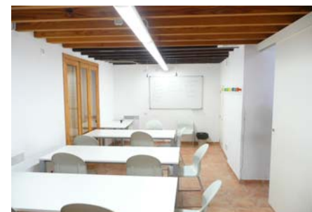
Aula planta baixa