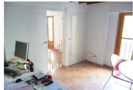
Despatx - Planta primera