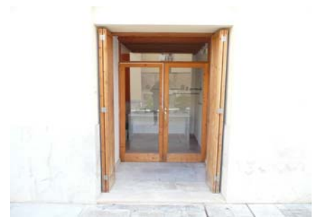
Accés a l'edifici

Existeix únicament una aula. La porta d'entrada a aquesta aula és corredera i permet un ample de pas superior a 0,80 m. Al llindar de la porta no existeix cap desnivell ni ressalt.