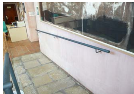
Rampa del vestíbul