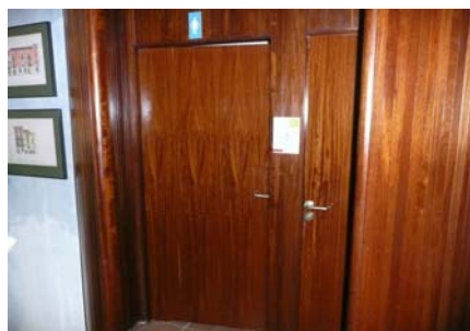
Entrada als banys