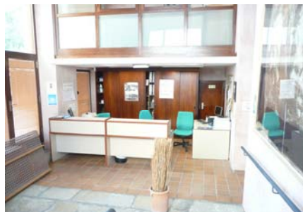
Atenció al públic