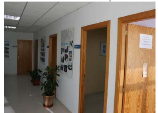
Zona d'ús públic