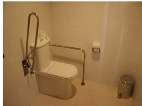
Inodor de la zona d'ús públic

Proposem que es modifiqui, al nucli d'ús públic, la posició del lavabo per que deixi una alçada lliure per sota de 0,70m i que el mirall es situe a una alçada, com a màxim, de 0,90m.