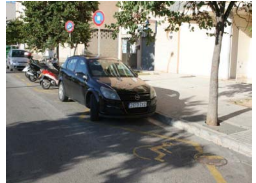
Places d'aparcament reservat