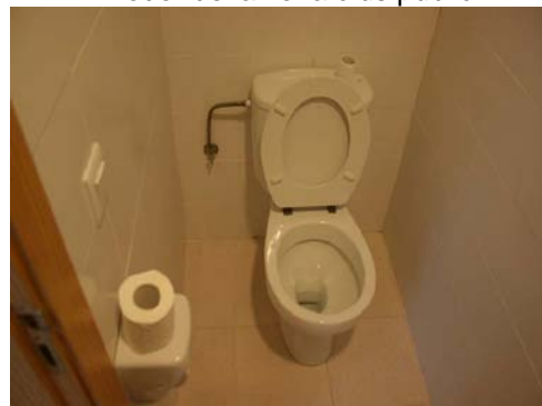
Inodor de la zona de treball intern