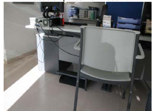
Mobiliari d'atenció al públic