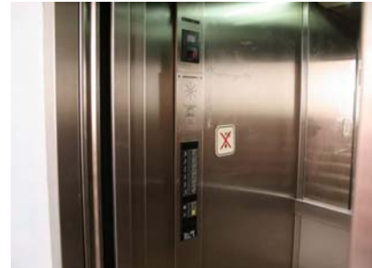
Ascensor. Botonera interior