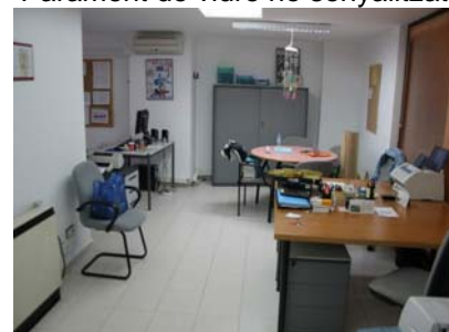
Interior del despatx administratiu