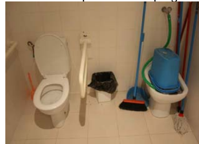
Bany adaptat - cambra de neteja