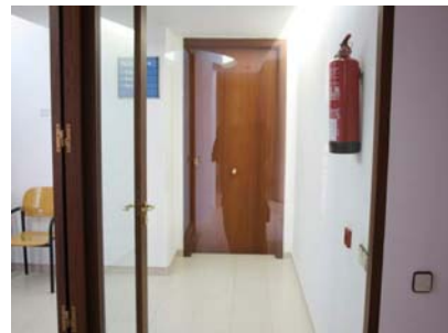
Parament de vidre no senyalitzat

Disposa de passamà a un dels costats, situat a 1,00m d'alçada i de traçat continu.