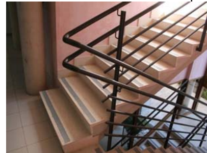
Escala amb senyalització de graons