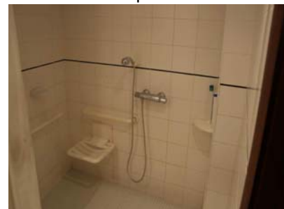
Seient i mecanisme al mateix plà