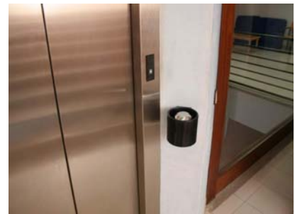
Ascensor. Botonera exterior