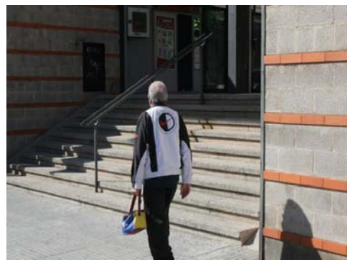
Escala de l'accés principal

Proposem la prolongació del passamà 25cm més enllà dels extrems, així com, la instal·lació de bandes de color i textura que contrasti amb el paviment, que abarqui tot l'ample de l'escala, situades a l'inici i al final d'aquesta. Proposem, també, l'eliminació dels bossells dels graons.