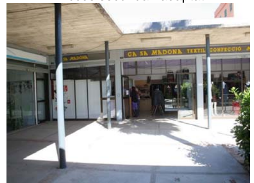
Pati interior, rètols