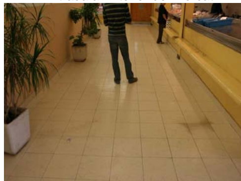
Corredor interior amb parades