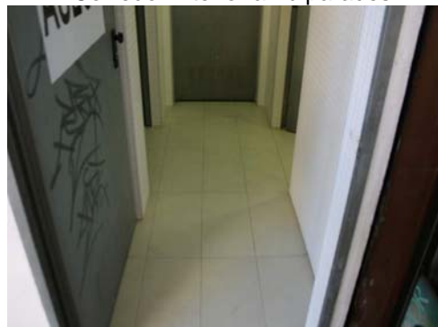
Vestibul d'accés a nuclis