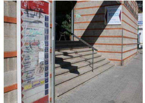
Accés principal amb directori