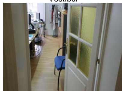
Interior despatx administratiu