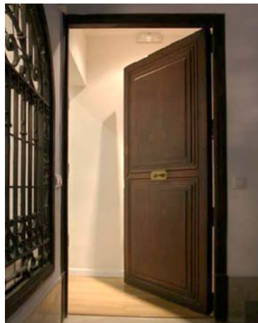
Porta d'entrada al centre