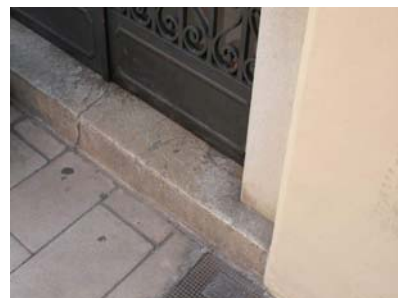
Graó exterior d'accés