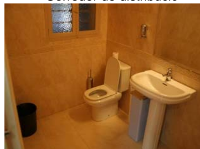
Cambra higiènica vestíbul