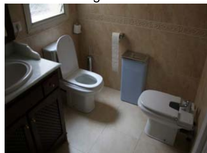
Cambra higiènica interior