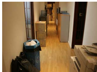
Corredor de distribució