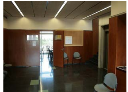
Accés a sala multiusos