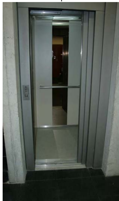
Cabina de l'ascensor