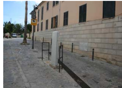
Paviment empedrat al carrer d'accés