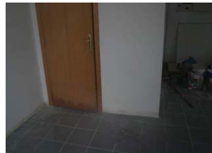
Interior del local