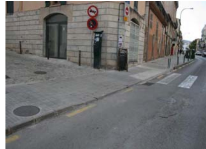
Doble accés al local