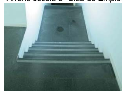
Punt perillós a "Club de Empleo" (desembarc desprotegit)