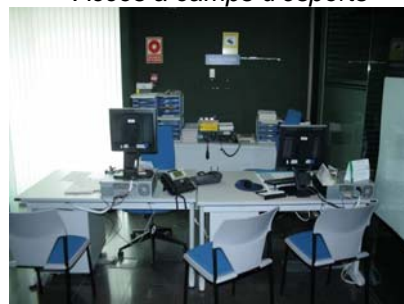
Atenció al públic a Policia