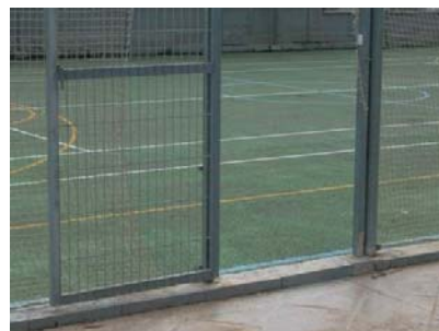
Accés a camps d'esports