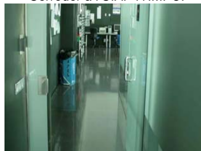
Corredor a Policia