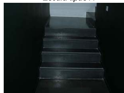
Arranc escala a "Club de Empleo"