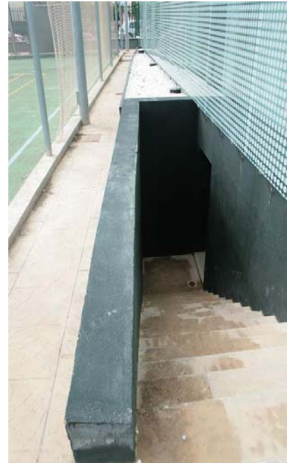
Escala tipus C a la zona d'esports