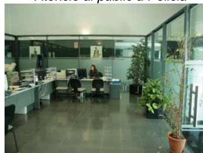
Atenció al públic a l'UIAP