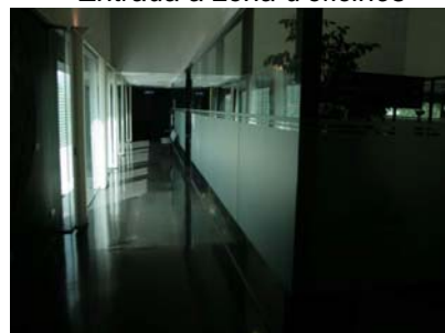
Corredor a l'UIAP i l'IMFOF