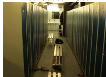
Vestuaris a sòtan