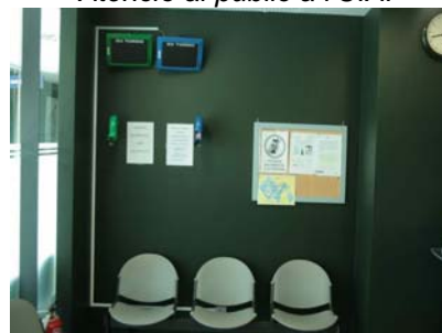
Màquines dispensadores de N°