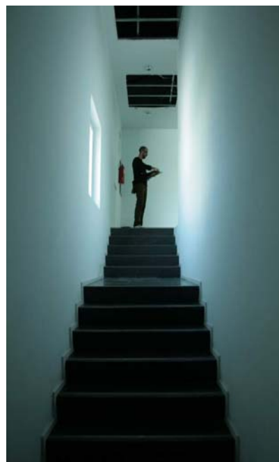
Escala tipus A