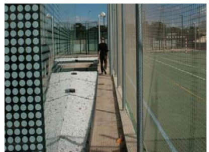
Itinerari a accés secundari