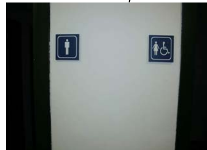
Senyalització de cabina adaptada