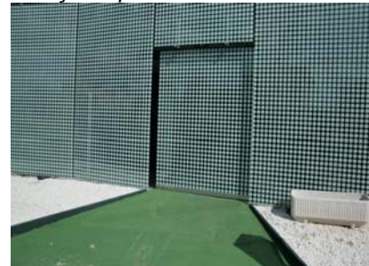
Porta d'accés automàtica