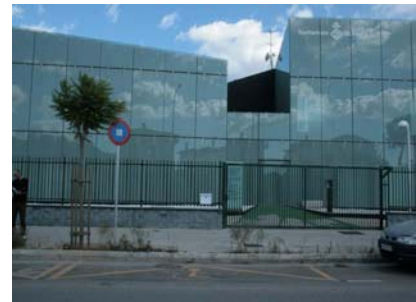
Plaça d'aparcament front a edifici